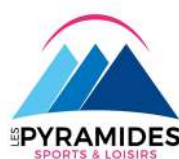
LES PYRAMIDES (Port Marty)